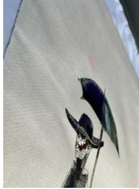
Durante o tratamento