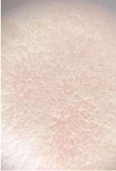
Visão microscópica (fibra absorveu a migração pictórica)