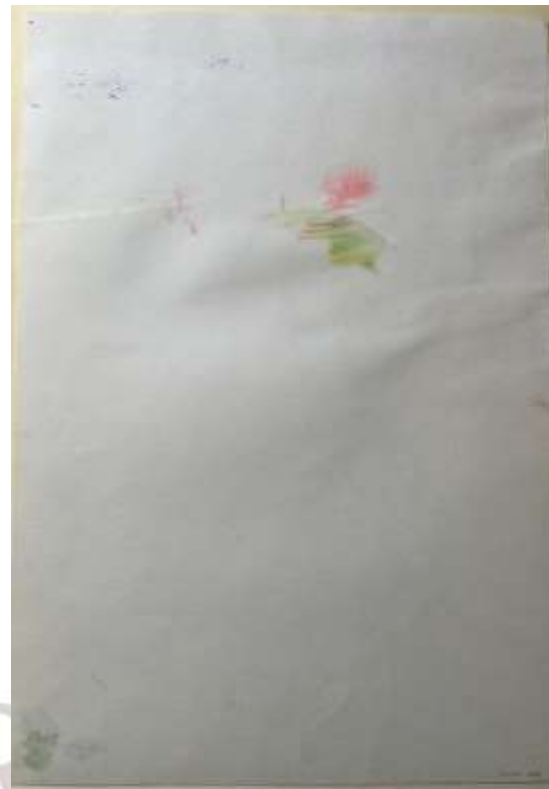
Verso da Obra (ondulações visíveis)