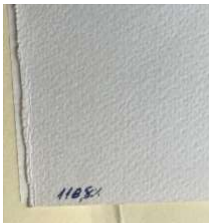
Inscrição a caneta esferográfica