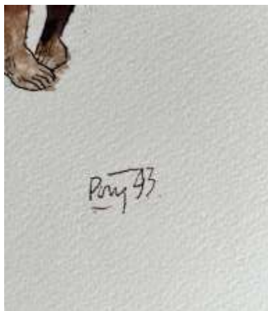
Assinatura do artista