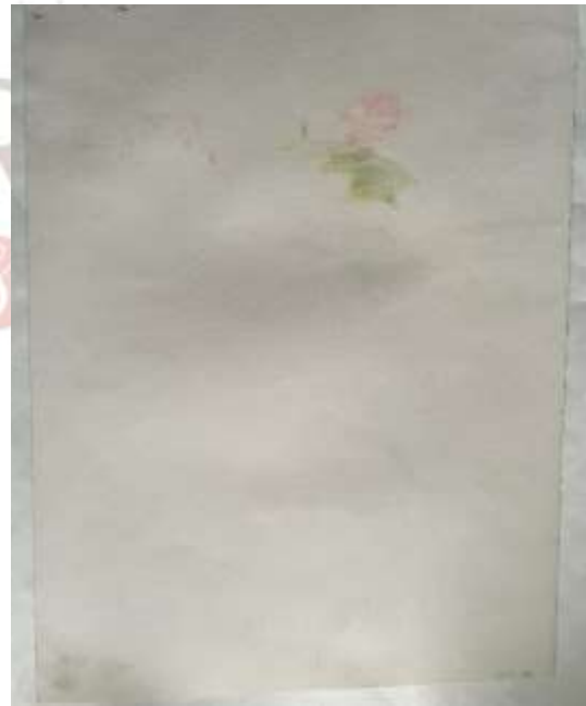
Durante o tratamento