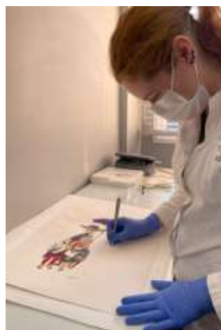
Remoção de excrementos