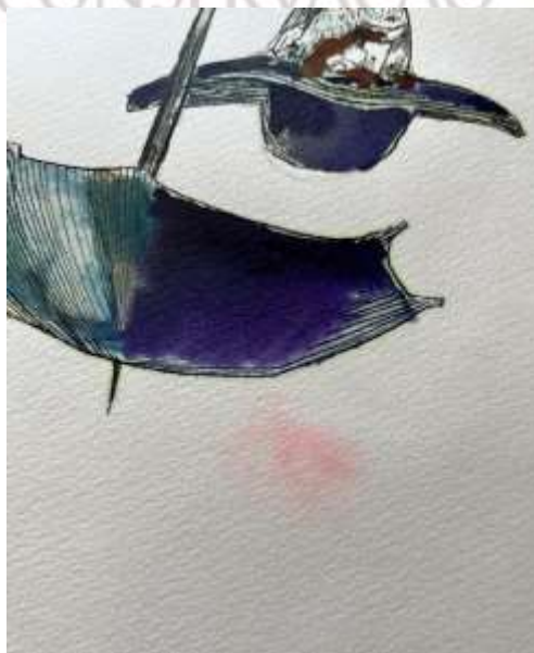
Detalhe de mancha (frente)