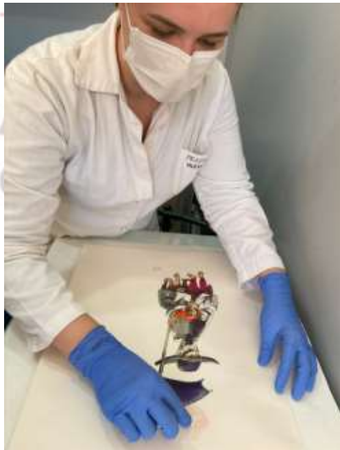
Durante o tratamento