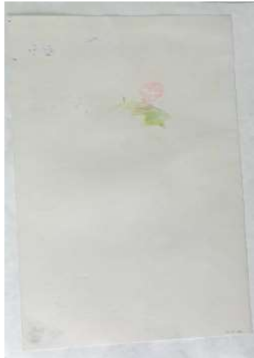
Verso da obra restaurada

ars et labor ATELIER PETRI CONSERVAÇÃO & RESTAURAÇÃO Sem maiores informações, assino este documento: