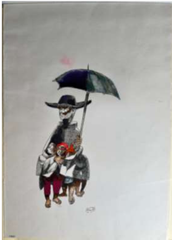
Frente da Obra