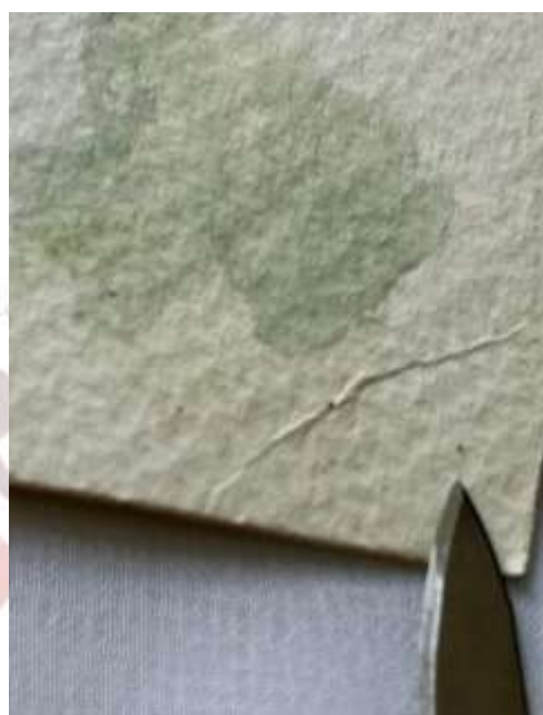
Pontos de excrementos de inseto e marca de dobra