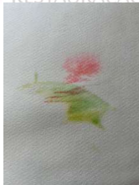
Detalhe de mancha (verso)