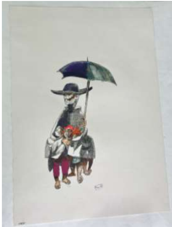
Frente da obra restaurada